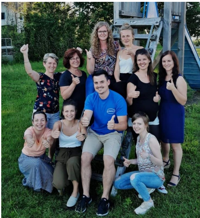
Foto aus dem Archiv vor Corona-Zeiten.