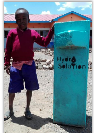
Wasserfilter von Hydro Solution

Die daraufhin entstandene Filterproduktionsstätte von Hydro Solution befindet sich nun auf dem Grundstück des Hauses der Gemeinschaft und somit besteht eine enge Vernetzung unserer Organisationen. Weitere Informationen zu Hydro Solution unter www.hydrosolution.org .