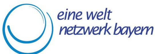
Logo "Eine Welt Netzwerk Bayern"

Seit mehreren Jahren nehmen wir aktiv teil an Veranstaltungen und regionalen Austauschtreffen des Eine-Welt Netzwerks Bayern, das bayerische Landesnetzwerk der entwicklungspolitischen Gruppen und Weltläden. Dadurch stehen wir im Austausch mit anderen regionalen Organisationen, die sich geografisch und/oder thematisch in ähnlichen Feldern engagieren, und nutzen Möglichkeiten des gegenseitigen Lernens.